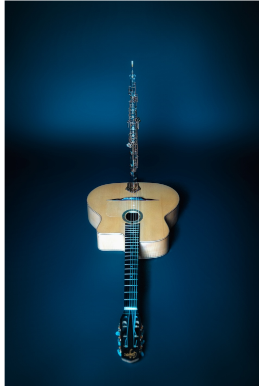
Guitare et hautbois