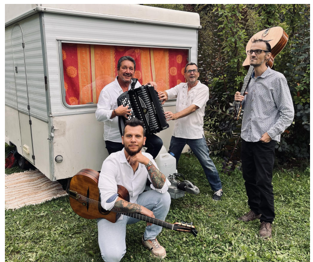
Set à la quarte

Passionnés, venant d'horizons différents, chacun influencé soit par le flamenco, le blues, le rock, la pop musique, la chanson française, les standards américains ou le jazz. Leur envie est de vous apporter énergie, joie et émotion en abordant ce style dans la simplicité et la bonne humeur.