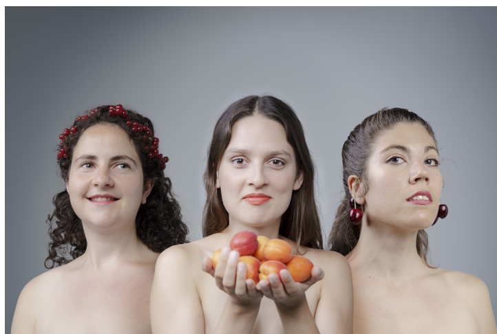
Trio Meydelech @Valentin Behringer