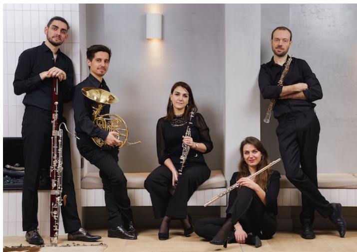
Quintette à vents Linos