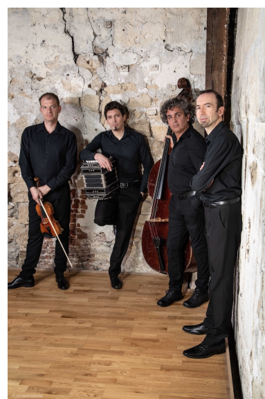
Quatuor Caliente