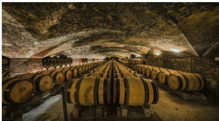
Château de Meursault - Caves

Lundi 7 juillet à 18h00, Château de Meursault, rue Charles Giraud Visite des caves et dégustation