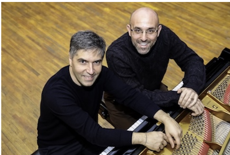
Marco Schiavo et Sergio Marchegiani

Parallèlement à leur activité internationale en solo, depuis 2006, ils jouent ensemble dans le monde entier, donnant près de 1000 concerts dans les salles et festivals les plus prestigieux, notamment à New-York, Vienne, Salzbourg, Berlin, Saint-Petersbourg, Rome, Paris, Zurich, Londres... Leur carrière fulgurante a fait d'eux des invités réguliers des grands orchestres. Leur dernier projet d'enregistrement est l'intégrale des œuvres pour piano à 4 mains de Mozart, enregistrée au Mozarteum de Salzbourg et publiée par Decca en 2021 et 2023.