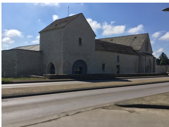
Maison-Dieu (Léproserie) de Meursault

Nombre de places limité. Réservation obligatoire.