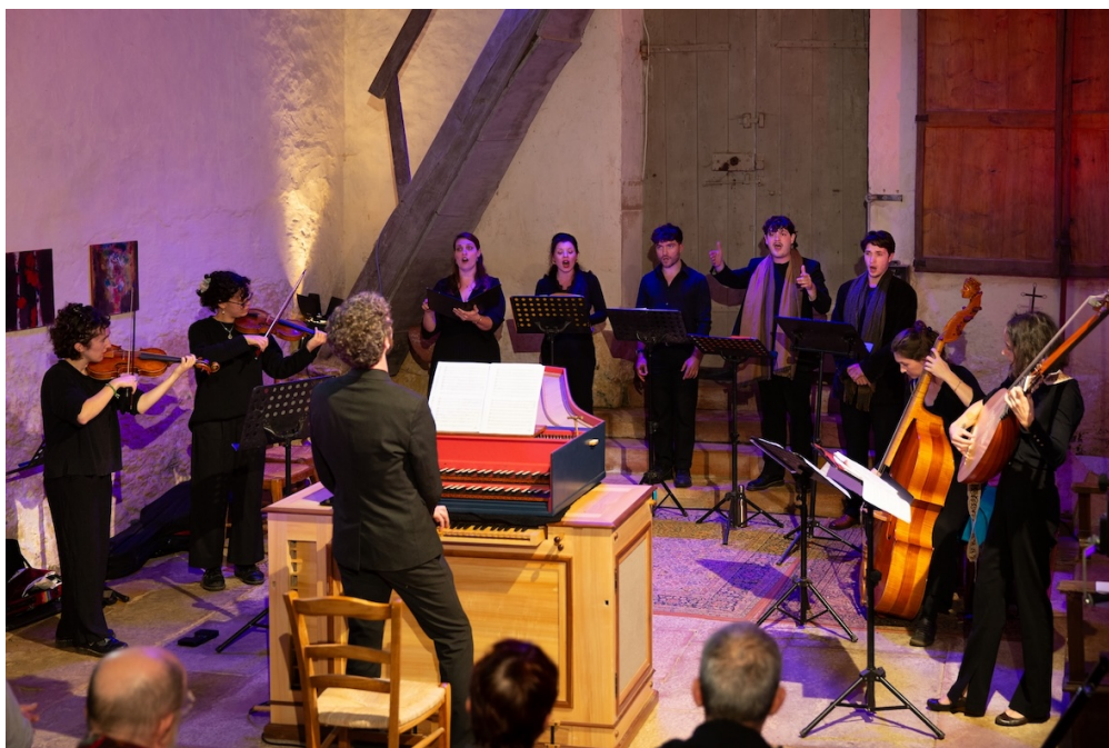
Ensemble R'nB

https://youtu.be/IUIfCphu41k?si=V8hR3OXn2apMBnKy