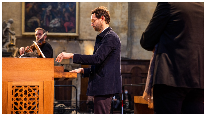
@ Alexandre Ollier