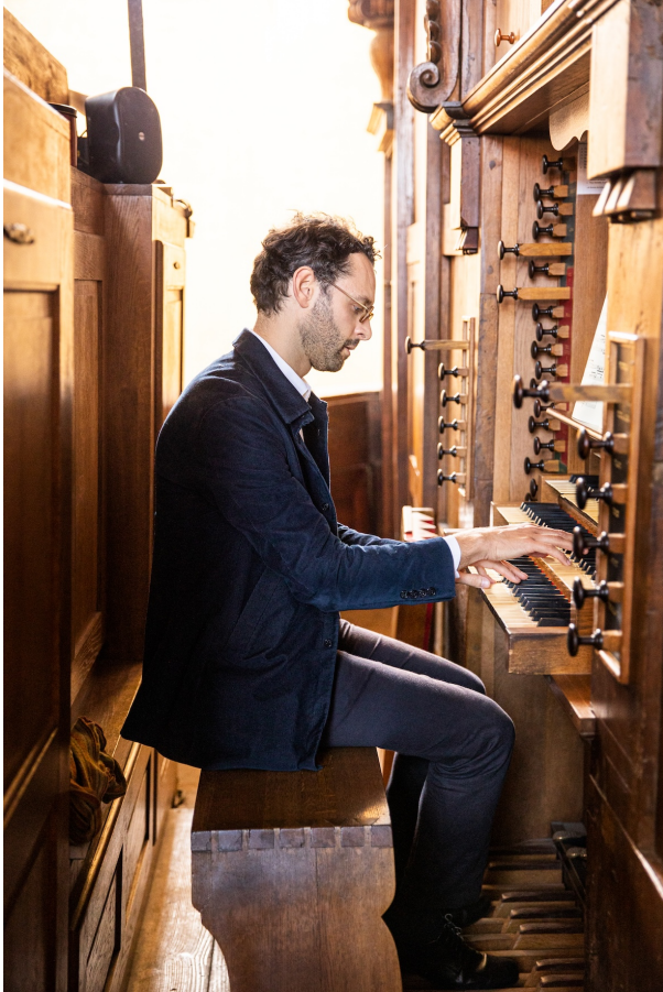
@ Alexandre Ollier