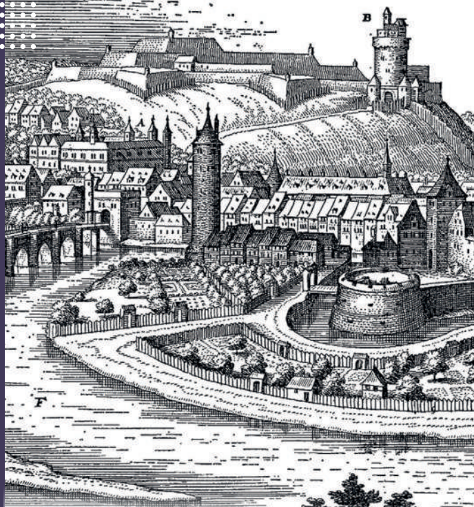
Gravure de Montbéliard de M. Mérian (1643)