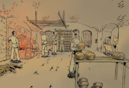
Illustration de la boulangerie du fort du Mont-Bart