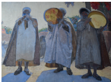
« Musiciens arabes » de Paul-Élie Dubois (1923) collection musées de Montbéliard