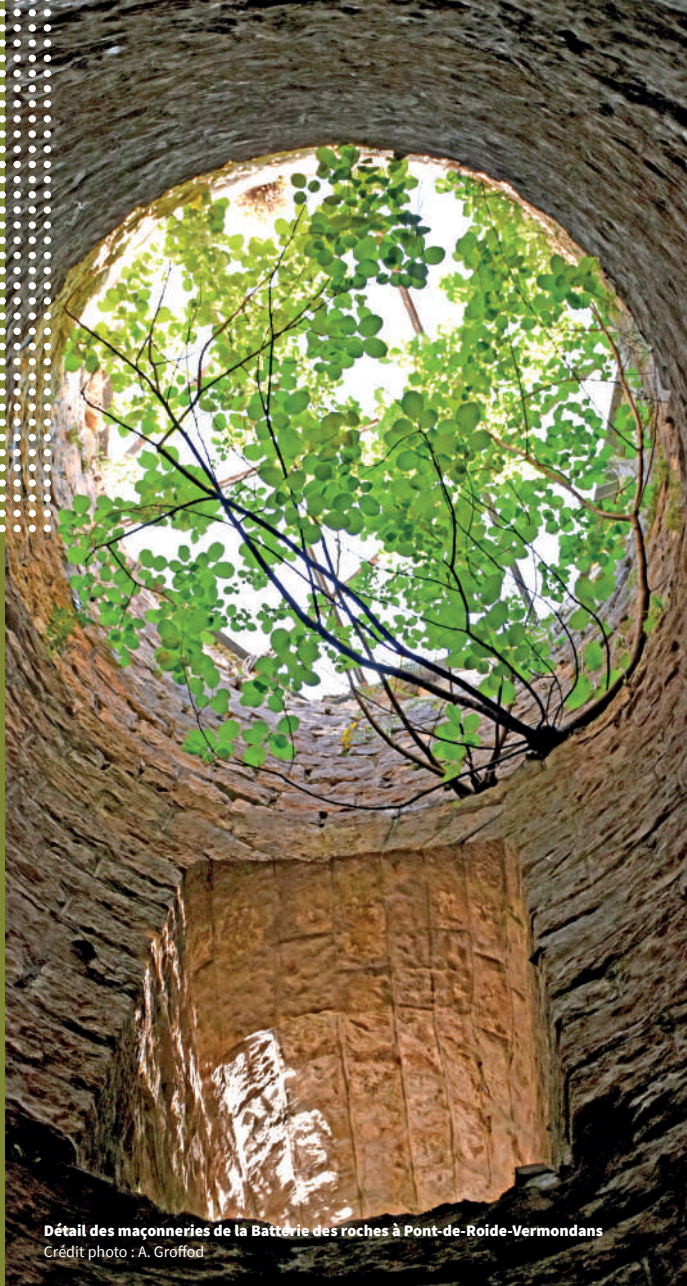
Détail des maçonneries de la Batterie des roches à Pont-de-Roide-Vermondans