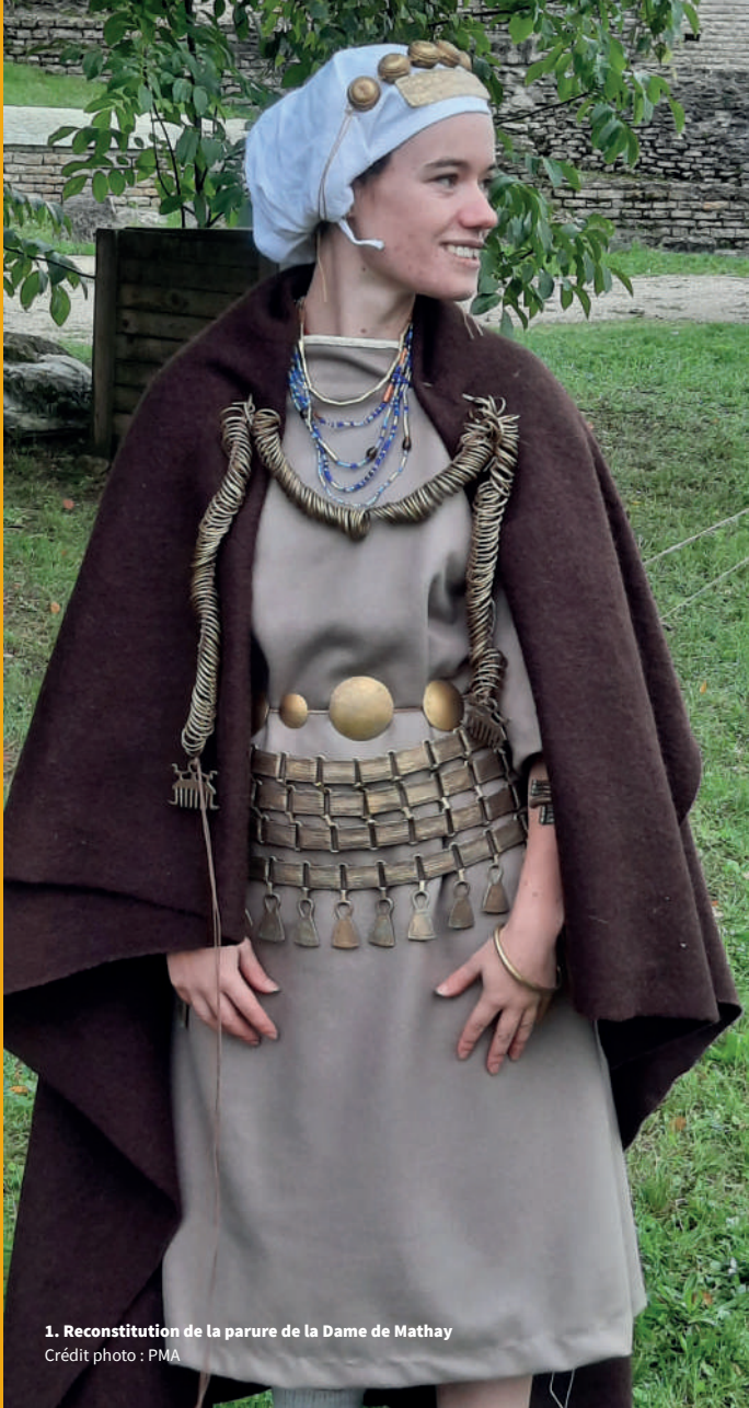
1. Reconstitution de la parure de la Dame de Mathay