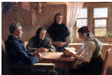
Tableau « la lecture de la Bible », G. Bretegnier (1892), collection musées de Montbéliard