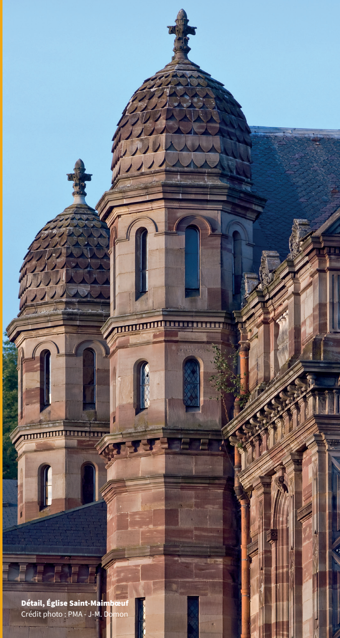
Détail, Église Saint-Maimboeuf