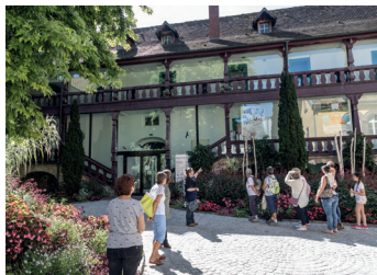
Centre-ville historique de Montbéliard

Réservation obligatoire au 03 81 31 87 80 ou sur agglomontbeliard.fr