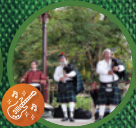
Les Sonneurs du Lion 14H30