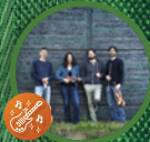
Hop Corner 11H