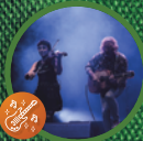
Grumpy O Sheep 16H

Brasseurs, restauration irlandaise, manège pour les enfants. Jeu de force. En partenariat avec Joa Casino.