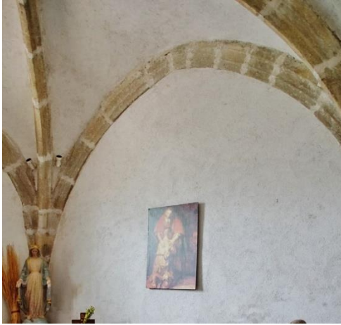
Voûte sur croisée d'ogives de la chapelle seigneuriale du XV e siècle