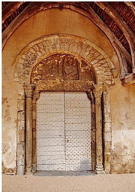
Portail principal roman

Le bas-relief qui décore le tympan de l'entrée principale est une stèle funéraire gallo-romaine en remploi, qui a été classée MH en 1923.