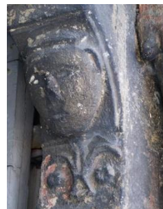
Corbeaux romans du portail sculptés de têtes