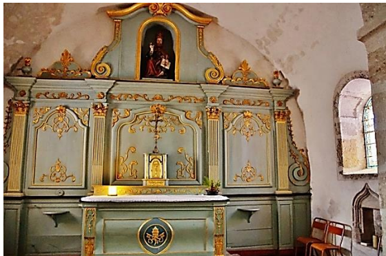
Retable du XVIII e siècle (1735)