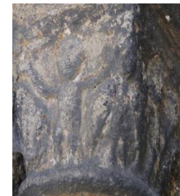
Chapiteaux romans du portail