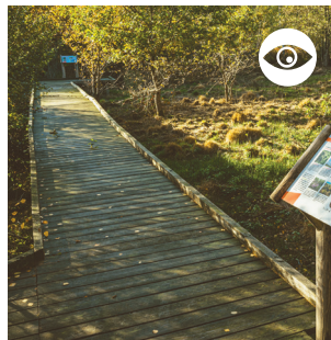
ZONE HUMIDE « LE MARAIS DE FONTAINE SAINTE »