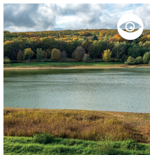
VUE INCONTOURNABLE SUR LE PLAN D'EAU ET LA FORÊT DOMANIALE