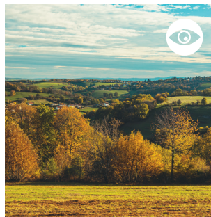
LIGNE D'HORIZON VERS L'EST