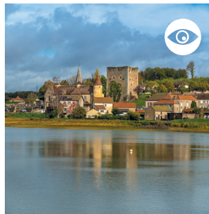
VUE SUR LE VILLAGE