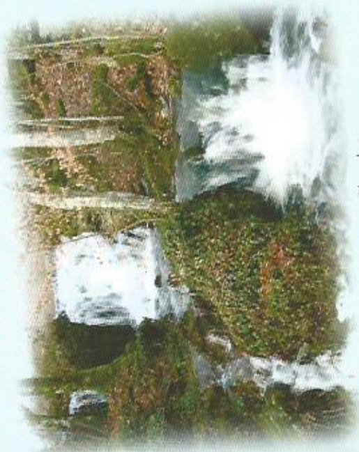
Cascade de la Plissoire

Saint-Sernin-du-Bois fut appelé un temps après la révolution "Montagne des bois". La diversité de paysages et reliefs : montagne, crêtes, vallons, vallées, plans d'eau, cascades et forêt de résineux et feuillus (600 hectares) attestent de cette dénomination.