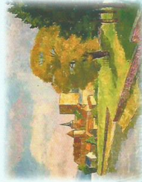
Tableau de Raymond ROCHETTE