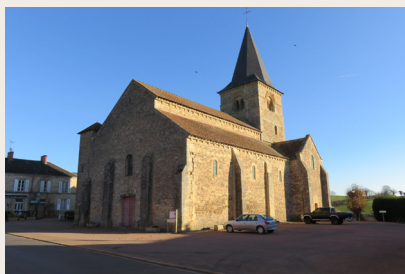
Eglise de Sémelay

ornementées de décors tous différents et 4 pilastres aux moulures variées. L'église de Sémelay est le seul édifice de Bourgogne dont les chapiteaux représentent pour la plupart le mal, le péché et les châtements.