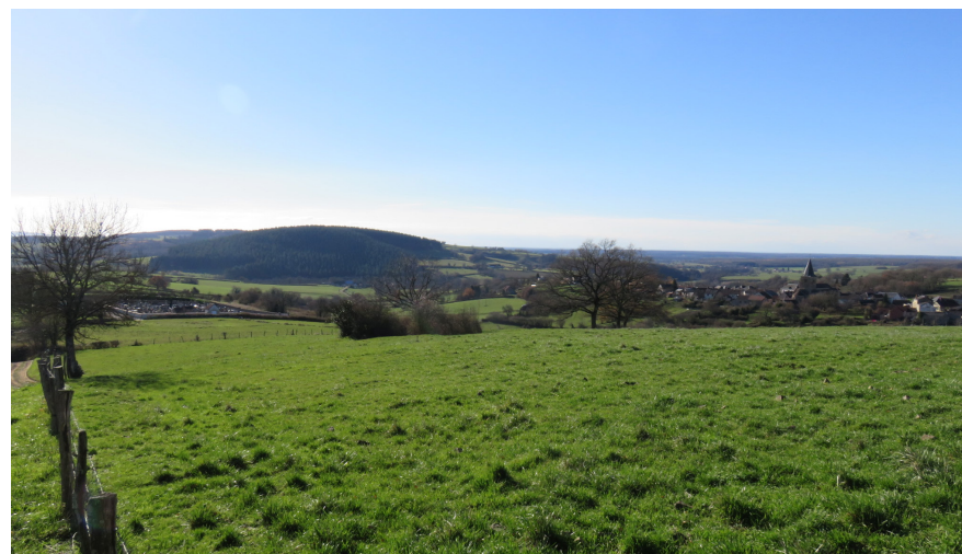
Au loin, les premiers contreforts du Morvan