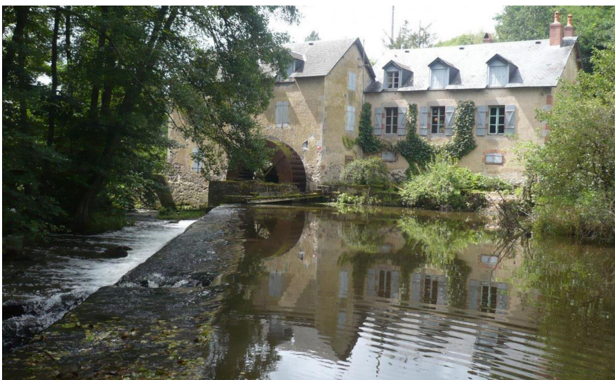
Moulin de Montécot