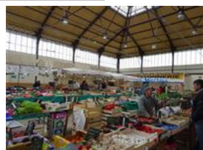
Office de Tourisme de Sens et du Sénonais