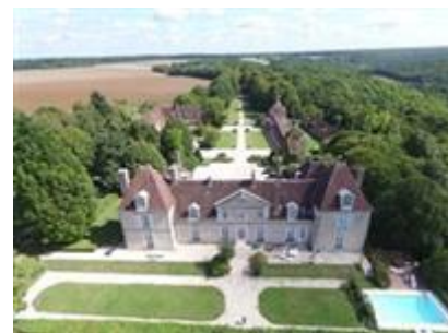
Château du Feÿ

Tarif de base##8##8#### || Gratuit#####12## || Tarif demandeurs d'emploi##6##6#### || Tarif jeunes##6##6####pour les 12-17 ans || Tarif réduit##6##6####pour les personne en situation de handicap