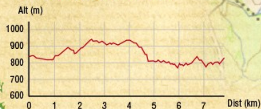
Profil topographique du circuit

Au départ de la place du 19 mars 1962, empruntez la D98 en direction de Fresse jusqu'au lieu-dit les Roches.