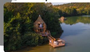
CABANES GRANDS LACS

Également situés en Franche-Comté, à 45 min de Belfort, les Grands Lacs vous propose un séjour unique et hors du temps dans 25 cabanes perchées ou flottantes.