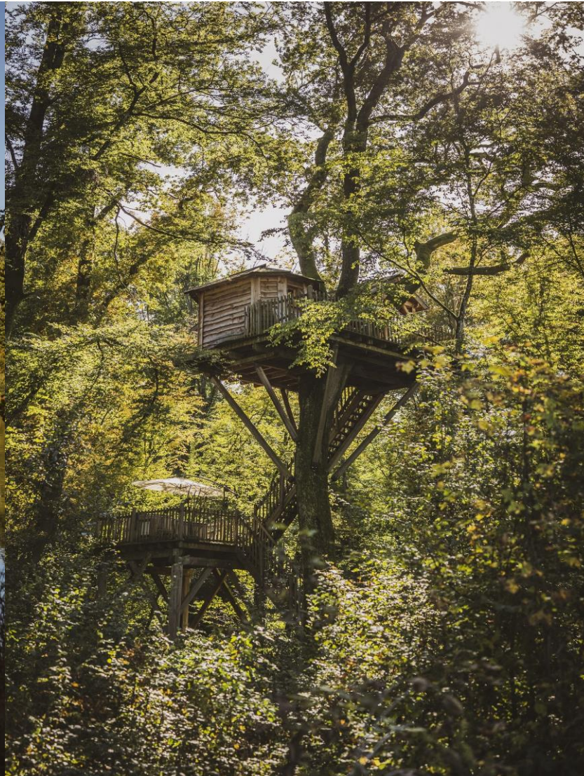
Cabanes dans les arbres