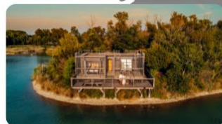
CABANES GRANDS CÉPAGES

Également situés en Franche-Comté, à 45 min de Belfort, les Grands Lacs vous propose un séjour unique et hors du temps dans 25 cabanes perchées ou flottantes.