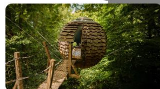
CABANES GRANDS CHÊNES

Situé à 1 heure de Paris, le domaine des Cabanes des Grands Chênes et ses 25 cabanes vous invite à un séjour perché dans une forêt de chênes centenaires.