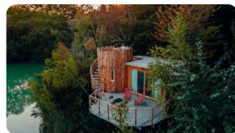
CABANES DE LA RÉSERVE

Situé dans l'Oise, notre tout dernier domaine des Cabanes de La Réserve et ses 25 cabanes sur pilotis se trouve à 1h15 de Paris.