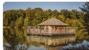
CABANES GRANDS REFLETS

Envie d'en savoir plus sur le domaine des Grands Reflets ? Vous êtes au bon endroit !