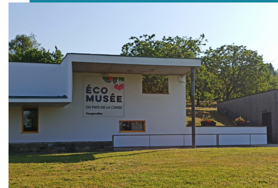
Ecomuseum van Kersenland

Ga na een korte klim linksaf bij de splitsing 4 en vervolg je weg omhoog