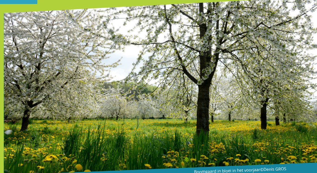
Boomgaard in bloei in het voorjaar

Onderweg ontdek je de verborgen verhalen van weideboomgaarden, bossen, beekjes en zandsteenrotsen, vormgegeven door tijd, natuur en mens. Een zintuiglijke en meeslepende reis door een levend landschap.