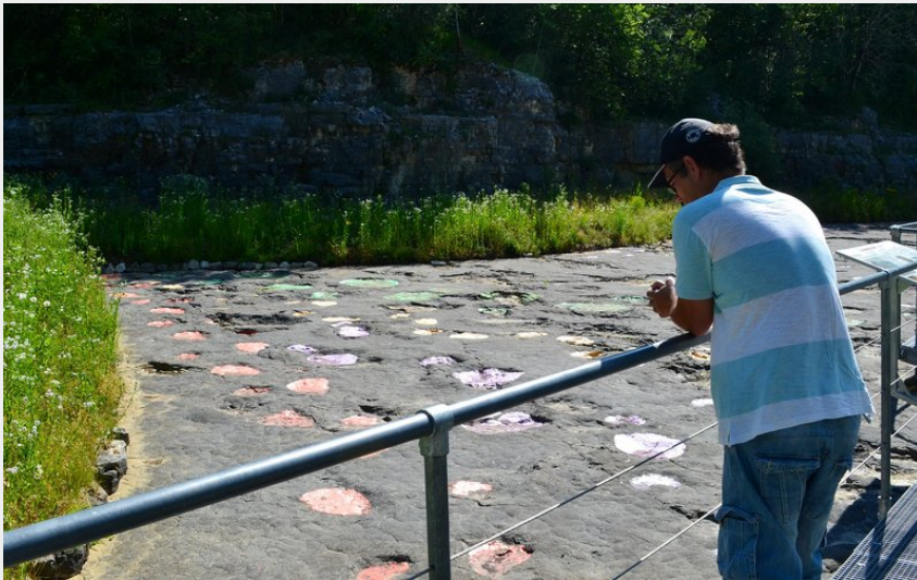
Traces de dinosaure à Loulle