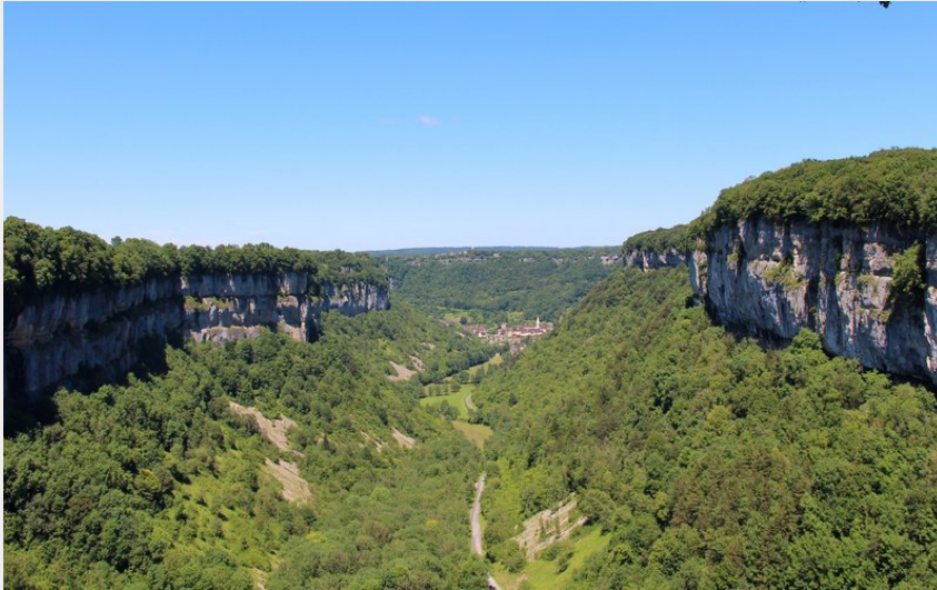
Baume-les-Messieurs depuis le belvédère de Crançot