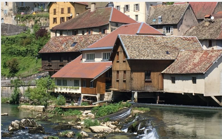
Les Forges de Lods