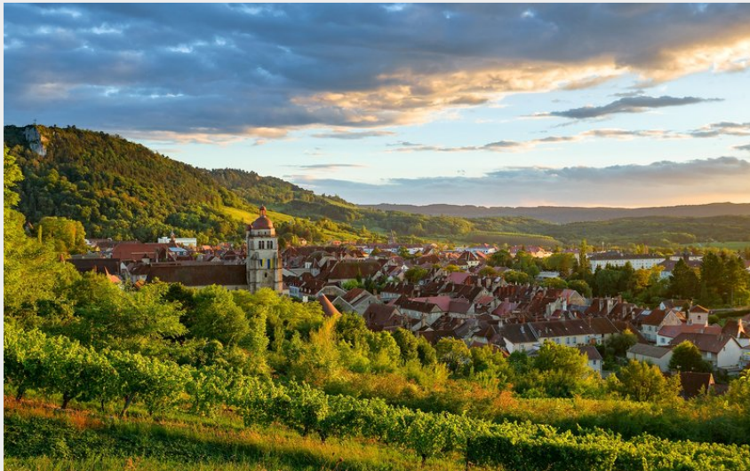
Ville de Poligny