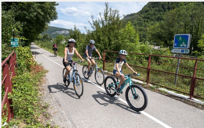
Eurovélo 6