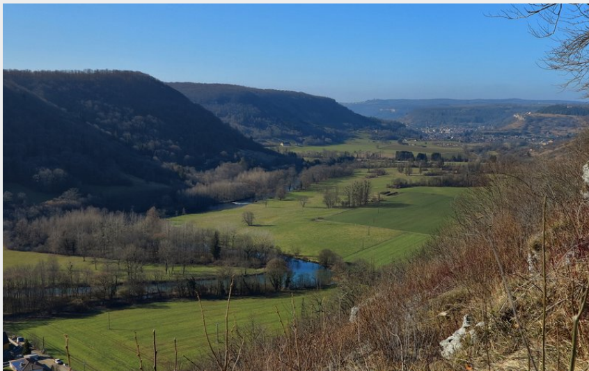
Belvédère de la Thuyère