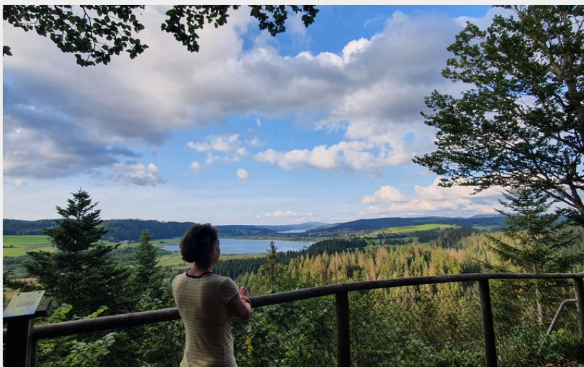
Belvédère des 2 Lacs