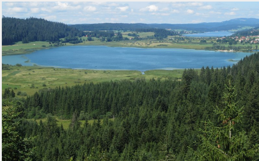
Vue sur les lacs de Remoray et de Saint-Point depuis le belvédère