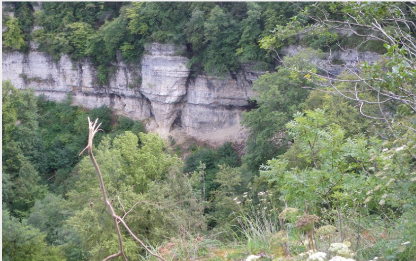
Point de vue du Dard (CCPSB)