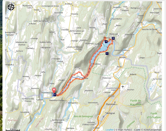
Lac de Coiselet depuis Montcusel

Le plus méridional des lacs jurassiens est une retenue artificielle créée en 1970 sur la rivière d'Ain. Haut-lieu touristique entouré de falaises, l'endroit mêle légendes et histoire.