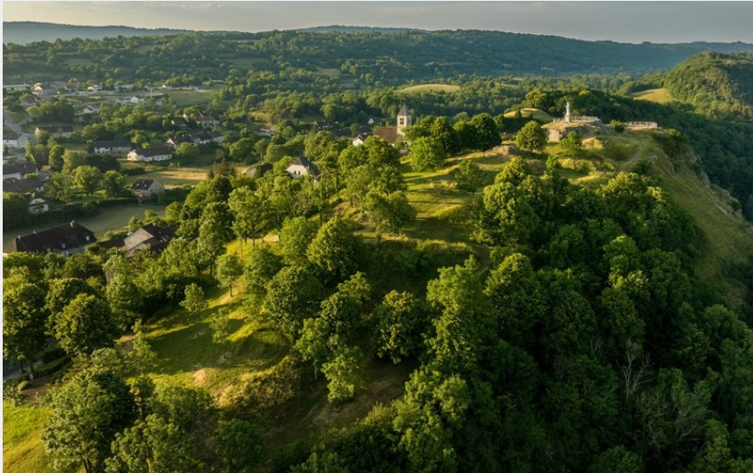
Village de Saint-Laurent-la-Roche