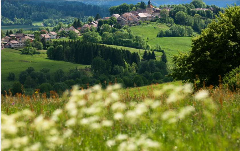
Village de Nozeroy