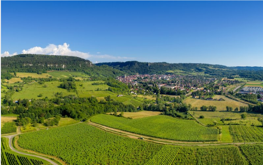
Poligny vue depuis les vignes