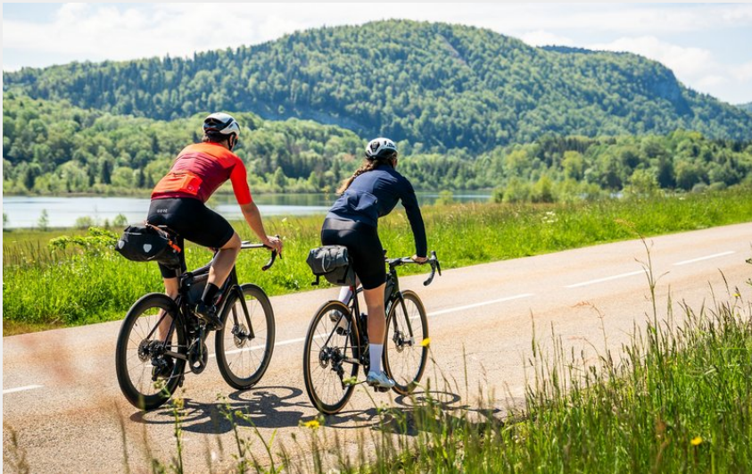
Cyclistes sur le plateau des 4 lacs