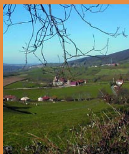
Corcelle vu de la tolee

vieilles bâtisses et accéder à une vue panoramique sur la vallée de la Saône et plus loin encore.