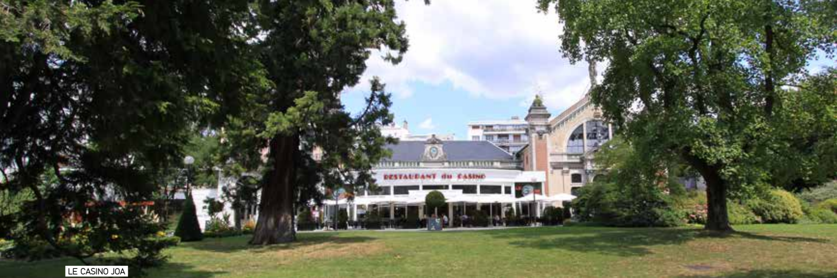
LE CASINO JOA