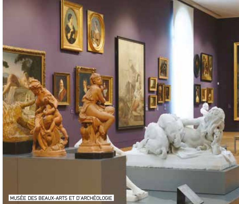
MUSÉE DES BEAUX-ARTS ET D'ARCHÉOLOGIE