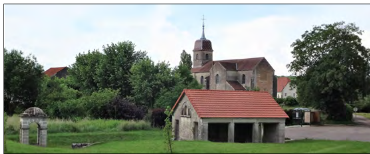
Lavoir et église de Denèvre (↑)