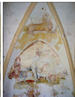
Le lavoir (←) et une fresque (→) dans l'église d'Achey