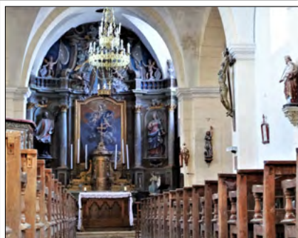
La nef de l'église de Montot

De l'église d'Achey, se diriger vers l'entrée du village côté Delain. Traverser la route et prendre un chemin à gauche qui gagne le sous-bois. A une clairière, prendre un chemin aussitôt à droite dans le bois. A la sortie du bois, prendre à gauche où le chemin descend. Peu avant le bas de la pente, tourner à droite et continuer jusqu'à la route qui rejoint Delain. A l'entrée du village, prendre à gauche le chemin « des champs Gobettes ». Longer le bois, puis prendre à droite un chemin qui descend vers Denèvre. Franchir le pont sur le Salon. A Denèvre, suivre à gauche la rue principale, puis encore à gauche une rue qui contourne l'église et passe devant un lavoir. En haut de la côte, prendre à gauche, puis à droite au calvaire (on rejoint le G.R. de pays). Suivre le G.R.P. et, après un second calvaire, prendre aussitôt à droite vers Montot. A l'entrée de Montot, prendre à droite. Passer le sous-bois devant la vierge, et continuer en direction du pont de pierre. Après l'avoir franchi, continuer tout droit direction Achey.