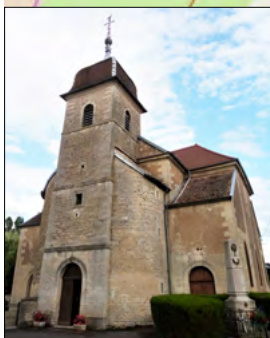
L'église de Delain