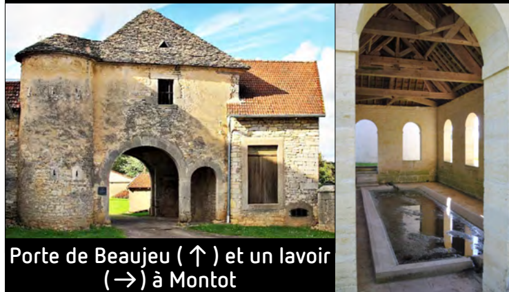
Porte de Beaujeu (↑) et un lavoir (→) à Montot

Imprimé par nos soins. – Ne pas jeter sur la voie publique.