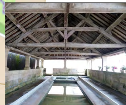
Le lavoir de Delain