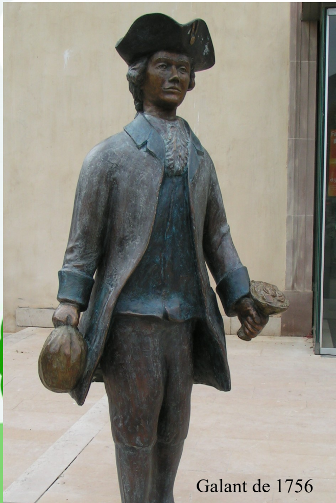
Galant de 1756