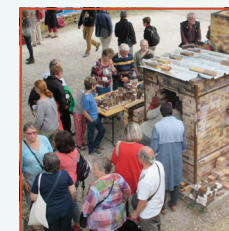
Cuisson bois, Festival