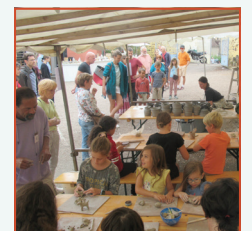
Atelier modelage famille, Festival