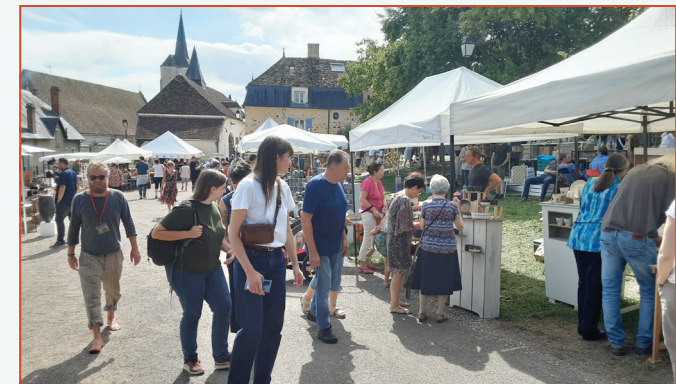
Festival de céramique, marché potier