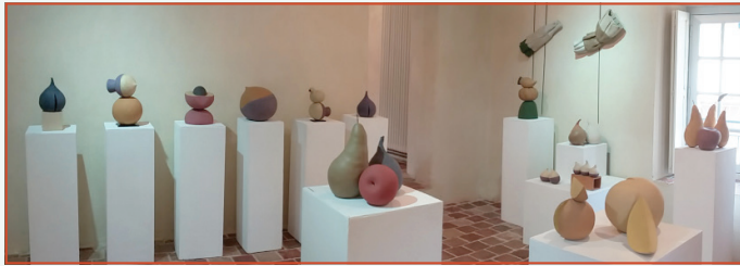
Salle d'exposition du Couvent