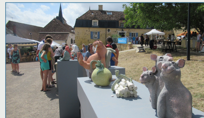
Festival de céramique, marché potier