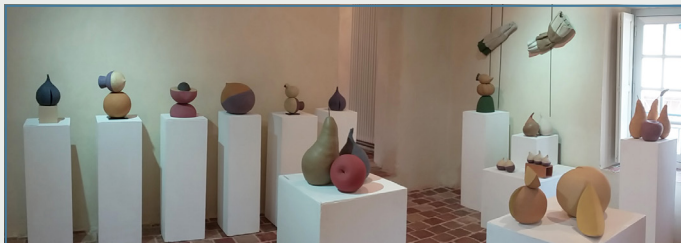
Salle d'exposition du Couvent