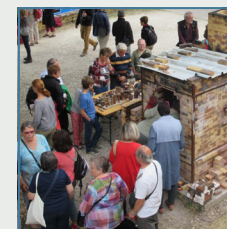
Cuisson bois, Festival