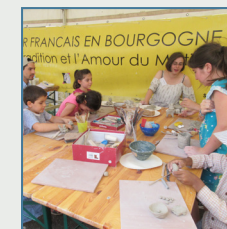
Atelier modelage famille, Festival