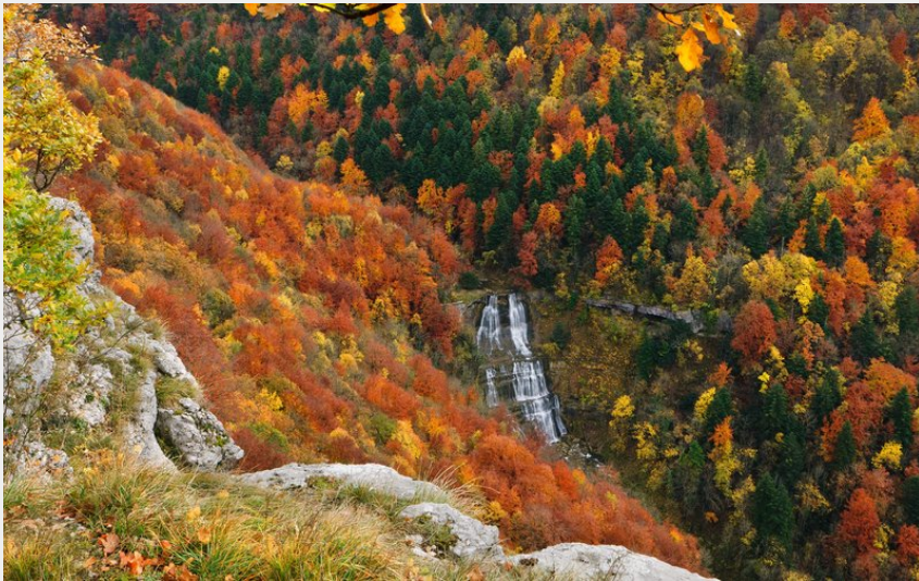
La cascade de l'Eventail depuis le belvédère de Menétru en Joux