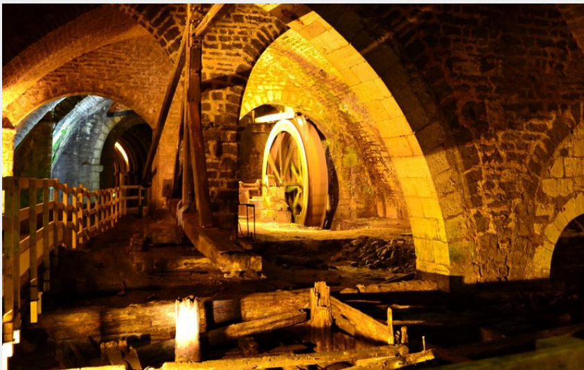
Grande Saline de Salins-les-Bains