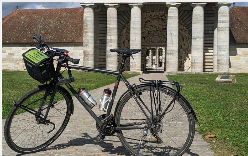
Arrivée à la saline (POC Studio)