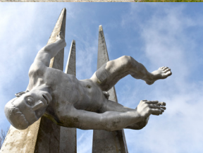
Un sommet avec de multiples points de vue