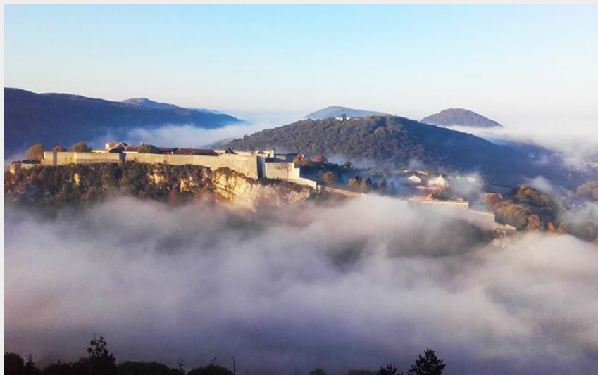
La citadelle vue depuis Bregille