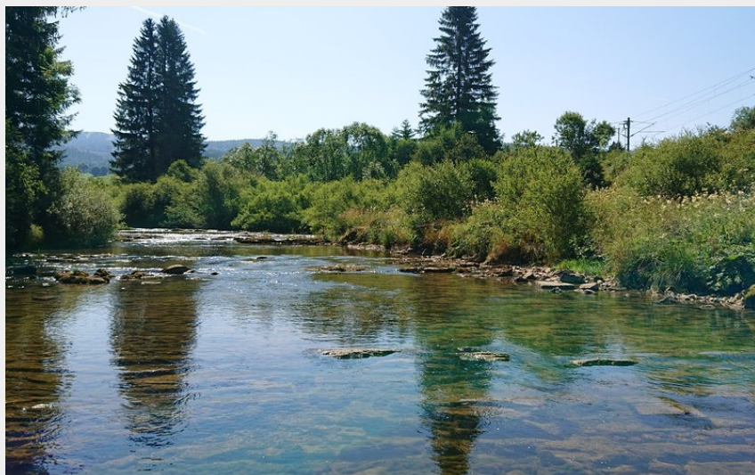
Rando dans les gorges du Fourperet