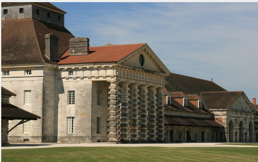
Saline Royale