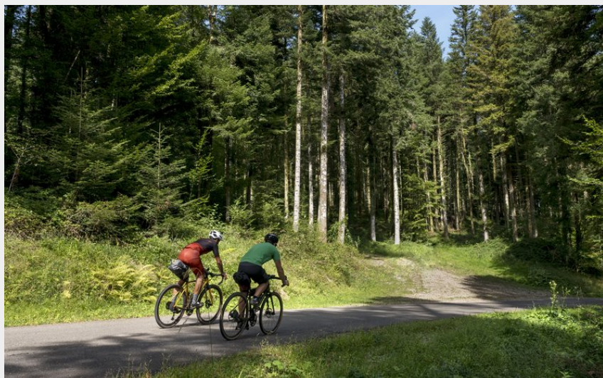
En vélo sur une petite route du Doubs