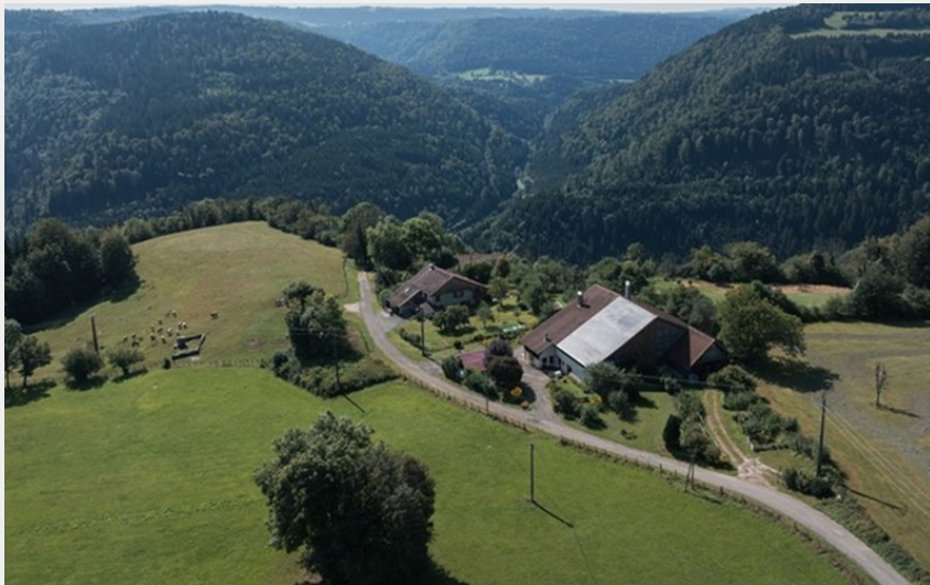
Le Saucet