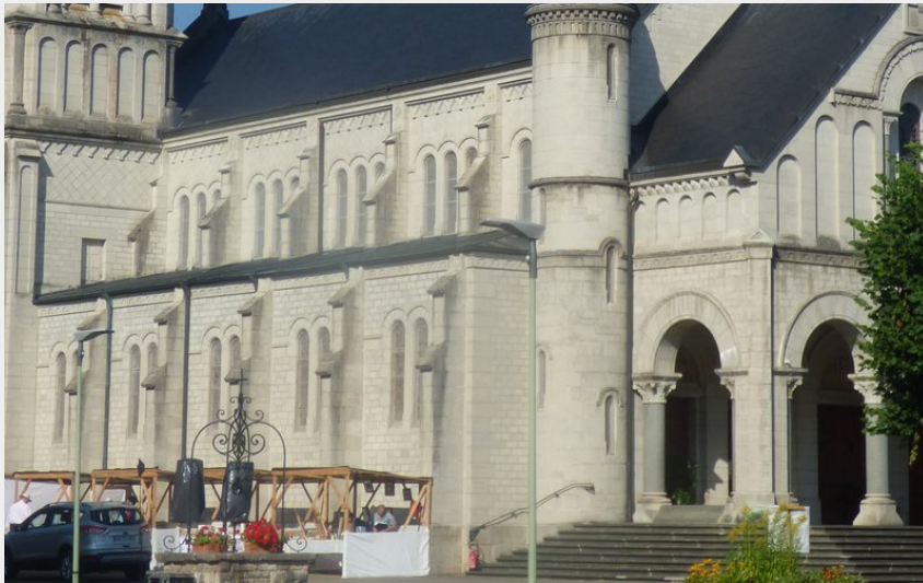
Basilique Sainte-Jeanne-Antide (CCPSB)