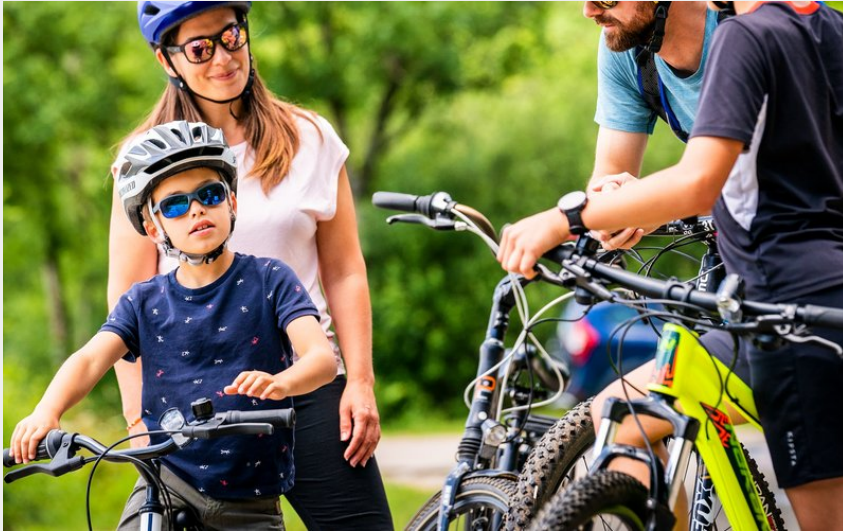
Famille en VTT