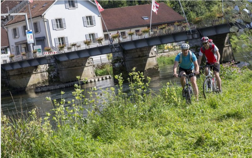
VTT vallon de Goumois, perle Franco Suisse (Laurent Cheviet)