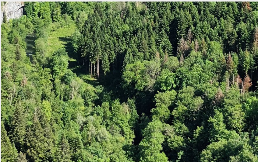
Alaise, la Gauloise