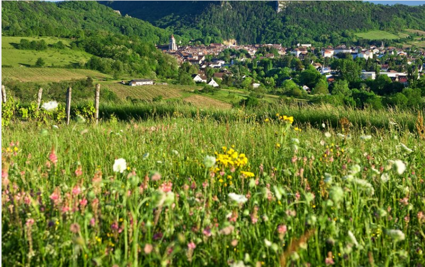
Poligny, Capitale du Comté