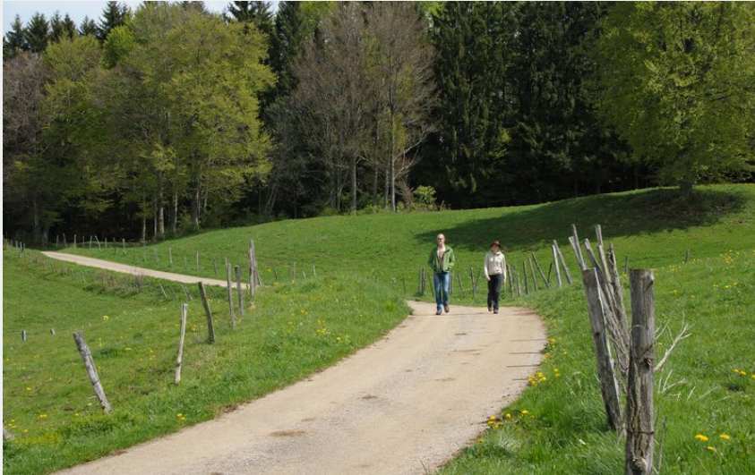
Randonnée La Source à Saint-Laurent en Grandvaux