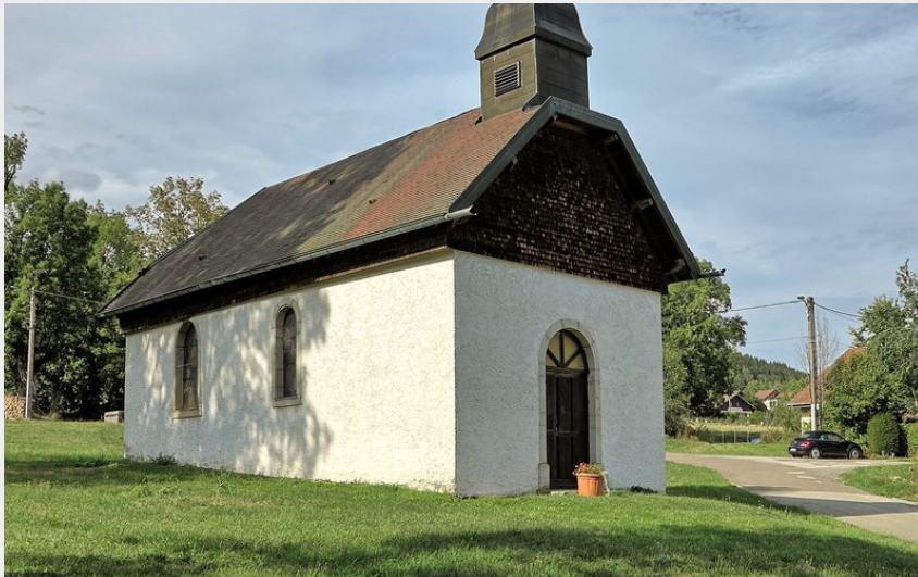
Chapelle du Saucet (CCPSB)