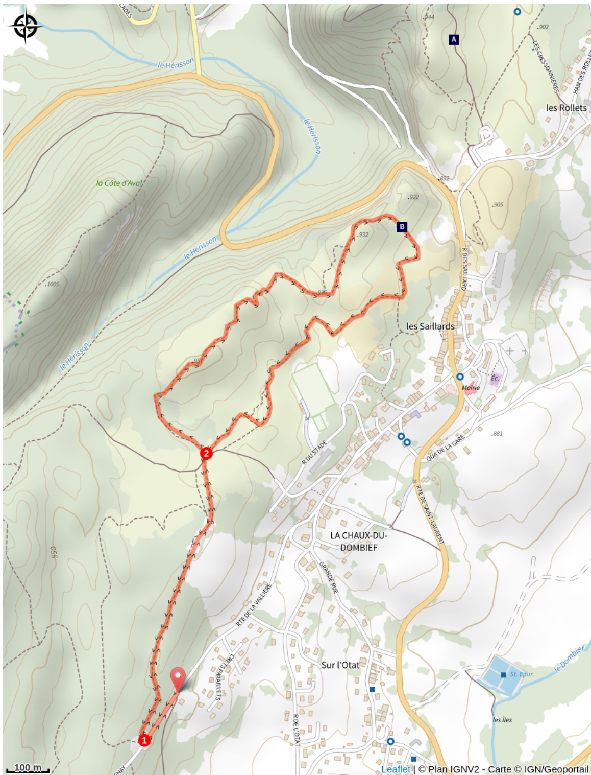
Les pelouses sèches (A)